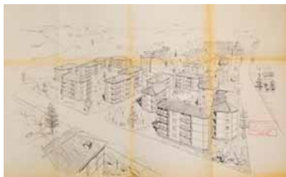
Disegno dell'assonometria dei blocchi detti "Trifoglio" realizzati all'Isolotto fra il 1956 e il 1958, su progetto di Angelo Di Castro. Il disegno reca il timbro di approvazione della Gestione Ina-casa del 14 gennaio 1956

mune, per ospitare costruzioni per i meno abbienti. Fra il 1930 e il 1932 furono realizzati due gruppi di 'casette rapide', di non più di due piani fuori terra, fornite di terreno utile alla realizzazione di piccoli orti e comprendenti la costruzione di servizi per i bambini (asilo e consultorio pediatrico). Il nuovo complesso di via Erbosa, realizzato negli stessi anni replicando i tipi edilizi precedenti, mostrava una ricezione superficiale degli stilemi razionalisti, forse grazie all'arrivo, presso l'ufficio tecnico dello Iacp fiorentino, del romano Alessandro Pancaro. La legge del 6 giugno 1935 aveva provveduto al riordino degli Istituti su base provinciale, fino ad allora nati come emanazione comunale. Con Decreto ministeriale del 15 luglio 1936, lo Iacp di Firenze venne riconosciuto come Istituto autonomo provinciale. L'attività edilizia tra il 1936 e il 1945 si fermò quasi, nonostante l'individuazione di aree idonee a nuove costruzioni nelle zone adiacenti al villaggio del Ponte di Mezzo, nelle vie Carlo Del Prete, Perfetti Ricasoli e nei pressi del Ponte alla Vittoria, vicino al blocco di via Bronzino. Le nuove costruzioni avrebbero ospitato gli sfrattati delle abitazioni da abbattere per consentire il 'risanamento' dei quartieri di S. Croce e S. Frediano. Nel frattempo, i Comuni della provincia premevano per otte-