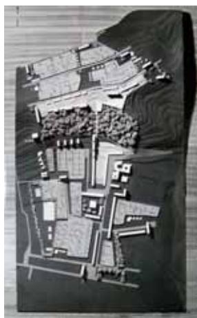
Foto del plastico della seconda versione del progetto per il quartiere di Sorgane a Firenze (1958)

L'archivio conserva la documentazione degli interventi di costruzione di edifici di edilizia residenziale pubblica finanziati dallo Stato, dai suoi organismi e dall'amministrazione regionale toscana. Durante l'alluvione, è andata perduta la documentazione relativa ai cantieri anteriori alla guerra, come gli edifici 'a blocco' di Giovannozzi e Burci, ma se ne trova traccia nelle pratiche per la loro manutenzione antecedenti al 1966, in cui il materiale relativo alla costruzione era stato talvolta riorganizzato.