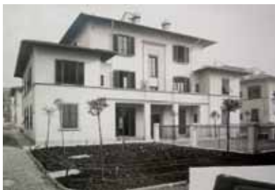
Foto d'epoca di una palazzina in via Carlo del Prete a Firenze. Modulo del 10° blocco, costruito nel 1930 e costituito da 33 edifici