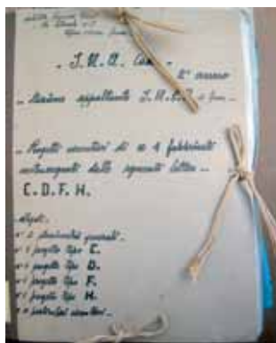
Cartella con il progetto di costruzione degli edifici del cantiere Ina-casa dell'Isolotto a Firenze n. 5572, con i disegni di Francesco Tiezzi (1952)

Ina-Casa o Piano Fanfani, dal nome del ministro del lavoro. Lo scopo principale del Piano era quello di creare occupazione favorendo la costruzione di case. I finanziamenti avvenivano con il contributo diretto dello Stato e con una trattenuta sugli stipendi dei lavoratori. Al termine della sua attività, nel 1963, l'Ina-Casa contava 355.000 appartamenti realizzati a livello nazionale. Alla progettazione delle case Ina erano incaricati i progettisti iscritti a un Albo formato in seguito al concorso dell'ottobre 1949, cui parteciparono 203 architetti e 137 ingegneri: i 191 prescelti erano quasi tutti giovani, laureati dopo il 1941. A Firenze fu pensato e realizzato a tempo di record, il villaggio dell'Isolotto. Padre del progetto fu Giorgio La Pira, già sottosegretario del ministro Fanfani, eletto sinda-