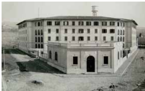
Foto d'epoca dell'edificio di via Moreni a Firenze. Il blocco era stato costruito nel 1930 e destinato ad albergo popolare. Nel 1936 fu trasformato in 63 quartieri

1903, a consentire agli enti e alle società impegnate nella costruzione di case popolari l'accesso ai crediti agevolati garantiti dallo Stato. Con il Testo unico sulle case popolari ed economiche del 1908 ogni Istituto poteva acquistare terreni da destinare alle costruzioni, comperare edifici, costruire case e amministrarle anche per conto del Municipio, istituire premi d'incoraggiamento per la costruzione e partecipare a istituzioni che avessero uguale scopo; poteva, infine, impiegare capitali in titoli di credito dello Stato, garantiti dallo stesso o dal Comune di riferimento. A norma del primo Statuto, del 16 agosto 1909, le case per le persone più povere, che l'Istituto costruiva o acquistava, potevano essere date solo in locazione. La progettazione e la manutenzione dei fabbricati erano affidate ad un ingegnere nominato dal Consiglio di amministrazione. Il primo progettista dell'Istituto fiorentino fu l'ing. Ugo Giovannozzi, che fu anche il primo proprietario della sede dell'ente, in via Fiesolana 5, da lui acquistata nel 1925.