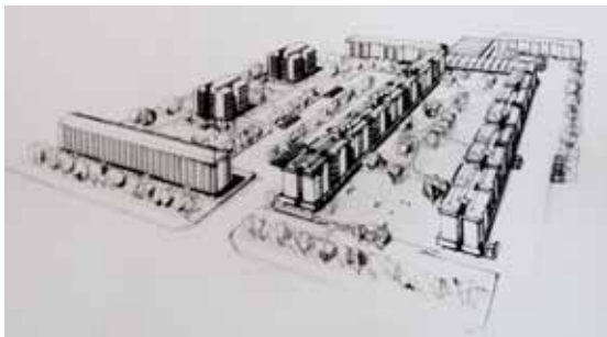
Disegno della veduta assonometrica del "Lottone" a Torricento, Firenze, fra via Argingrosso e via S. Maria a Cintoia. Progetto redatto dall'Ufficio tecnico dello Iacp per la realizzazione di 8 edifici con 365 appartamenti e 18 negozi (1971-1977)

nelle serie già individuate. Le nuove acquisizioni avvengono regolarmente nel corso dell'anno, anche grazie alla campagna di selezione programmata che Casa Spa effettua in base al massimario.