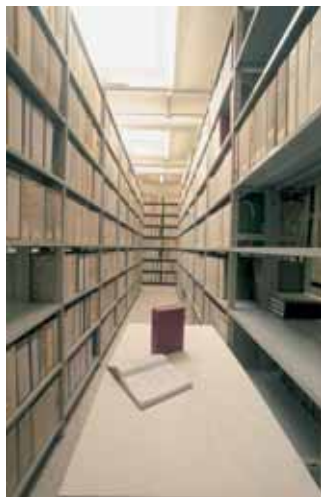
Le scaffalature dell'Archivio delle case popolari di Firenze

come i progettisti dell'ufficio tecnico dell'Istituto per le case popolari. La documentazione conservata in questo archivio riveste inoltre valore di testimonianza non solo per l'architettura, ma anche per la storia sociale, la storia del paesaggio, del territorio e l'evoluzione urbanistica delle nostre città. In questo senso, interessanti sono gli atti dei cantieri per i nuovi quartieri di Sorgane e dell'Isolotto, perché documentano in quale misura le case popolari abbiano contribuito a dare una precisa connotazione ad intere aree della città di Firenze.