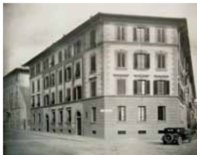
Foto d'epoca di una delle palazzine per il ceto medio finanziate con una legge del 1926 e realizzate in varie zone di Firenze, in via Pisana (6 fabbricati di 49 alloggi), via Mannelli (5 fabbricati di 44 alloggi) e nel Quartiere Vittoria (17 fabbricati di 172 quartieri)

Tra il 1926 e il 1928 vennero realizzati progetti che rispondevano a differenti fabbisogni abitativi: uno 'ultrapopolare' e l'altro destinato al ceto impiegatizio. Con la costruzione di un edificio per il 'Ricovero temporaneo', nei pressi di via Manni (via Moreni), si voleva dar sollievo all'urgenza dei più poveri ma, nel 1933, se ne prospettò il mutamento d'uso, compiuto nel 1938, con la conversione dell'edificio ad asilo dell'Opera nazionale maternità e infanzia. Nella medesima zona tra il 1929 e il 1931 fu realizzato il grande complesso a tre corti delle vie Manni, d'Orso e Gelli. Questo progetto era sintomatico della tendenza dell'Istituto a urbanizzare zone della città che allora erano in aperta campagna, dove si tendeva a far migrare il ceto popolare, mentre i programmi edilizi del Regime determinarono lo 'sventramento' di alcune zone del centro storico. Sempre negli stessi anni fu