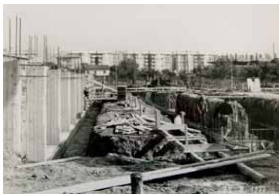
Foto presa durante la costruzione del lotto Qd 24 a Torri Cintoia, Firenze, via Canova 25. Progetto redatto dall'Ufficio tecnico dello Iacp per la realizzazione di 7 edifici con 240 appartamenti (1977-1979)

L'Archivio delle case popolari di Firenze conserva anche gli atti dell'attività edilizia dei comuni della provincia