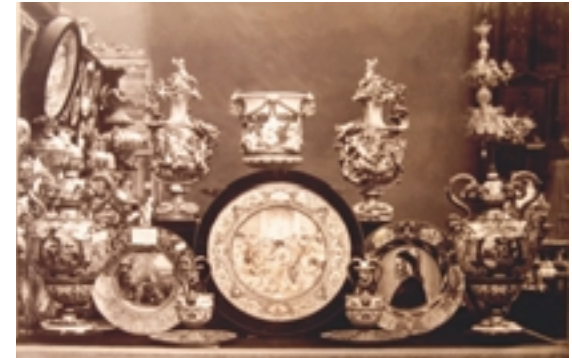
Ceramiche artistiche Ginori all'esposizione universale di Parigi del 1867

te commerciali, in particolare delle committenze illustri rimane poco; addirittura nulla, invece, dei magazzini nati negli anni Settanta dell'Ottocento a Milano, Bologna, Torino, Roma e Napoli, fatta eccezione per ordini e deliberazioni relative al personale commesso. Per quanto concerne i rapporti con la committenza, dallo studio delle carte si evince che era prassi agire per mezzo di agenti, di maestri di casa o di segretari, sia nel caso di privati che di enti pubblici, tutte trattative che prevedevano solo la re-