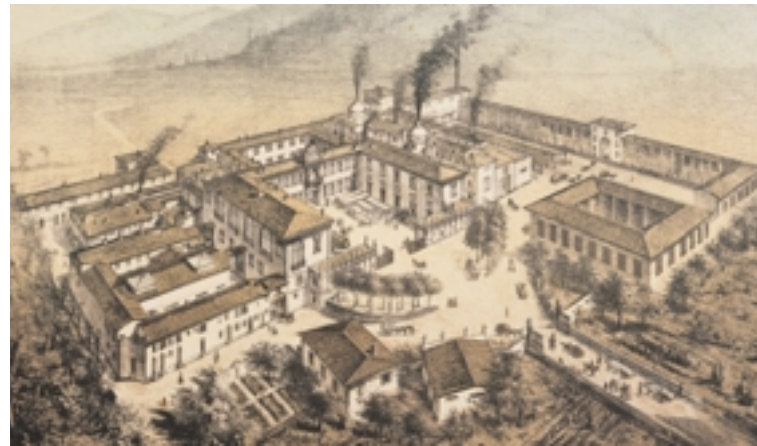
Veduta dell'antica Manifattura di Doccia, 1865 circa

La Manifattura fondata da Carlo Ginori nel 1737 è anche nota con il nome della località in cui nacque, cioè Doccia. Toponimo piuttosto diffuso in Toscana, significa 'condotta per l'acqua' e, nel nostro caso, identifica un luogo del territorio di Sesto Fiorentino situato ai piedi del Monte Acuto, nei pressi di Colonnata. I Ginori erano originari della vicina Calenzano e da secoli possedevano terre nella pianura a nord di Firenze, tra le colline preappenniniche e l'Arno. A Doccia, in posizione panoramica, sorgeva la villa in prossimità della quale si sviluppò la gloriosa produzione ceramica. Nel 1958 l'attività si trasferì in un nuovo stabilimento, aperto a Sesto nel 1950 e tuttora operante.