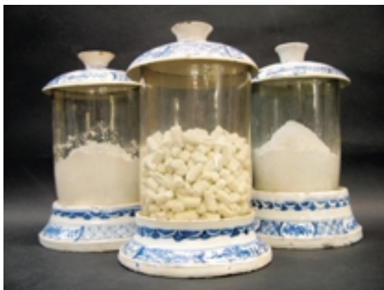
Vasi del “Museo delle Terre”, maiolica Ginori e vetro, 1740 circa

figura come sua parte integrante. La raccolta di ceramiche e opere plastiche, costituita da circa 8000 pezzi, trae origine dagli acquisti del fondatore stesso, il marchese Carlo Ginori, allo scopo di dotare la fabbrica di una galleria di modelli plastici da riprodurre in porcellana, ovvero terrecotte, gessi, cere e impronte in zolfo di cammei antichi. Già l'esistenza di questo primo nucleo di opere e di altri oggetti, che rientrano in categorie particolari come i prototipi, le prove di cottura degli smalti, delle paste, gli scarti di fornace, dimostra che la logica di formazione della raccolta è stata fin dalle origini, oltre che autocelebrativa e didattica, anche archivistica. Una serie significativa in questo senso è il settecentesco Museo delle terre , campioni di terre e minerali contenuti in vasi di maiolica e vetro che rinviano a un registro conservato nell'archivio. In esso si riportavano le relazioni sul reperimento e la resa dei materiali provenienti dai territori toscani, veneti e d'oltralpe. Sono prove che vengono effettuate anche oggi; infatti, nel laboratorio di chimica dell'attuale stabilimento esistono armadi di contenitori non dissimili da quelli antichi, conservati con la medesima finalità. Molti oggetti