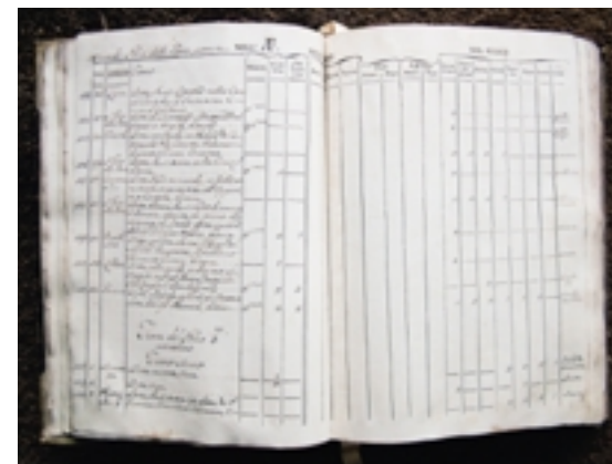
Classificazione e annotazioni riguardanti il “Museo delle Terre”, manoscritto cartaceo, XVIII secolo

della collezione furono messi da parte, quindi, prima che per essere esposti, per essere studiati, classificati e utilizzati per la ricerca e lo sviluppo della produzione con una logica per l'epoca modernissima.