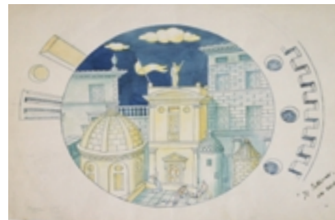
Gio Ponti, Il fattaccio , disegno acquerellato su carta, 1925-30

degli anni Novanta del Novecento. Si segnalano gli schizzi di Gio Ponti inviati in calce alle sue lettere, ma anche su cartone e fogli d'album; i disegni di Elena Diana eseguiti su indicazioni dell'architetto per le porcellane e le incisioni a punta d'agata, e di Vittorio Faggi per le maioliche. I disegni del periodo di Ponti sono stati oggetto di una importante campagna di riproduzione fotografica da parte della Soprintendenza ai beni storico-artistici nel 2000 e di numerosi restauri avvenuti tra il 1990 e oggi, finanziati in occasione di prestiti per mostre dagli stessi enti richiedenti o da associazioni culturali che hanno 'adottato' i disegni bisognosi di intervento.