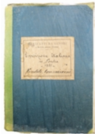
Registro di vendite Esposizione Italiana di Londra , manoscritto cartaceo, 1888