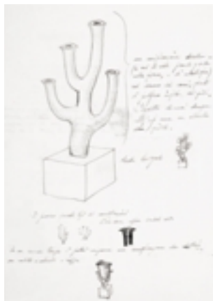
Gio Ponti, lettera autografa con schizzi e appunti per alberello porta fiori , 5 ottobre 1924

Sono considerati parte integrante dell'archivio anche un cospicuo corpo di disegni costituito da più di 4000 pezzi su